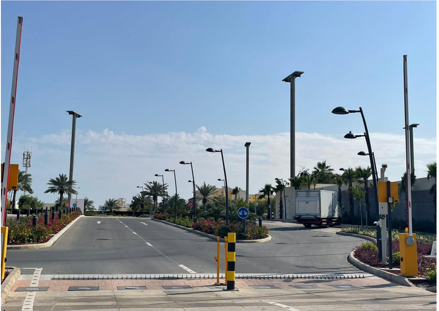
Vialia Evo ILVE

BENITO installe 126 ensembles lumineux autour d'un hôtel à Doha.