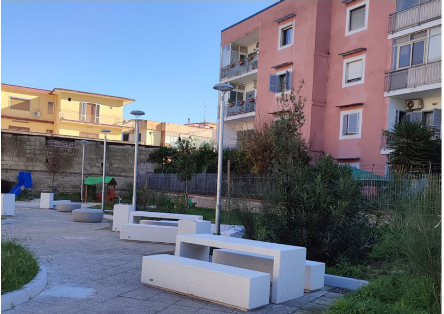
Citizen Clear ILCZ0

Casavatore, commune italienne située dans la ville métropolitaine de Naples, a opté pour les produits BENITO.