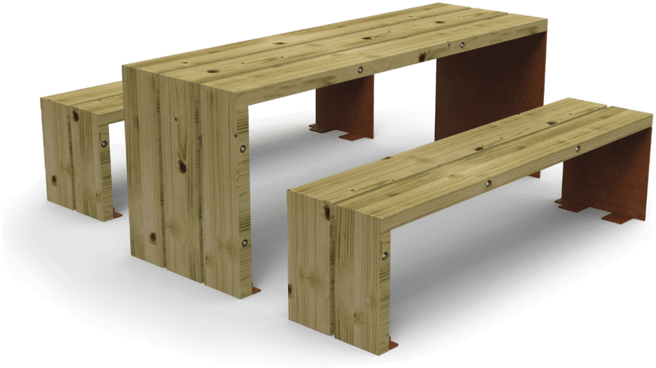
Table en bois de pin traité en autoclave vide et pression classe IV contre les vrillettes, termites et insectes. Visserie en acier inoxydable. Piètement en tôle d'acier Corten de 8 mm.

Ancrage recommandé : au moyen de boulons à expansion M10 en fonction de la surface et du projet.