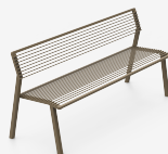
CORO METAL UM3D72