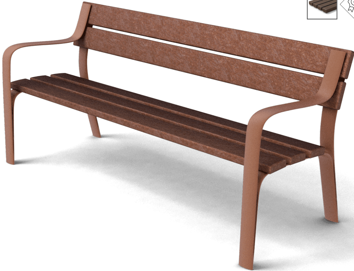
Citizen Eco UM301SPR