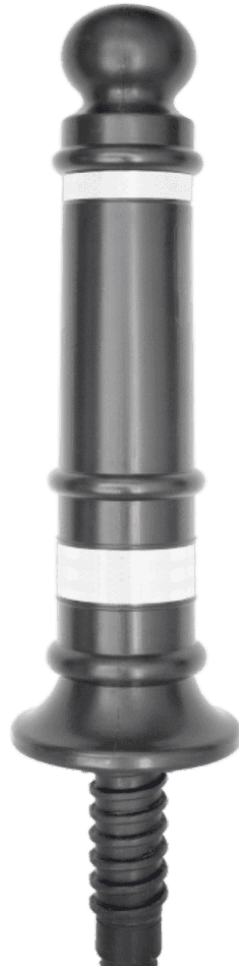
Fourreau encastrable H100B