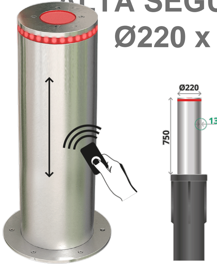
TELESCÓPICA AUTOMÁTICA Ø220 x 600mm H6008