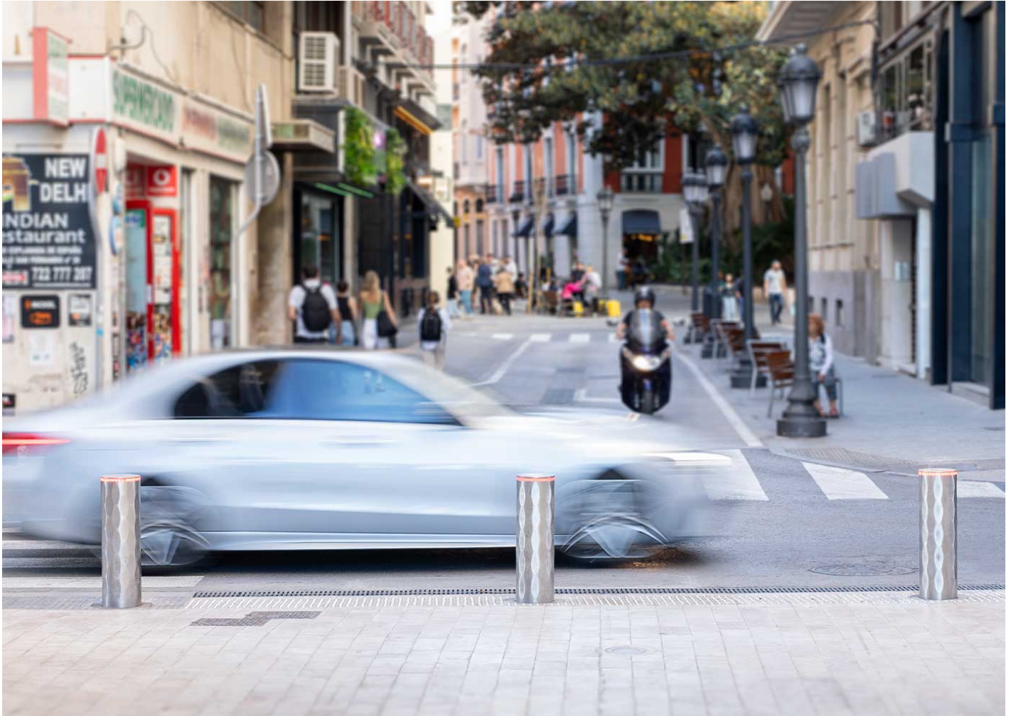
RAMBLA Ø220x750 H7508R

New automatic LED-equipped Rambla bollards have been installed in the city center of Alicante, with the aim of blocking vehicle access to the seafront promenade.