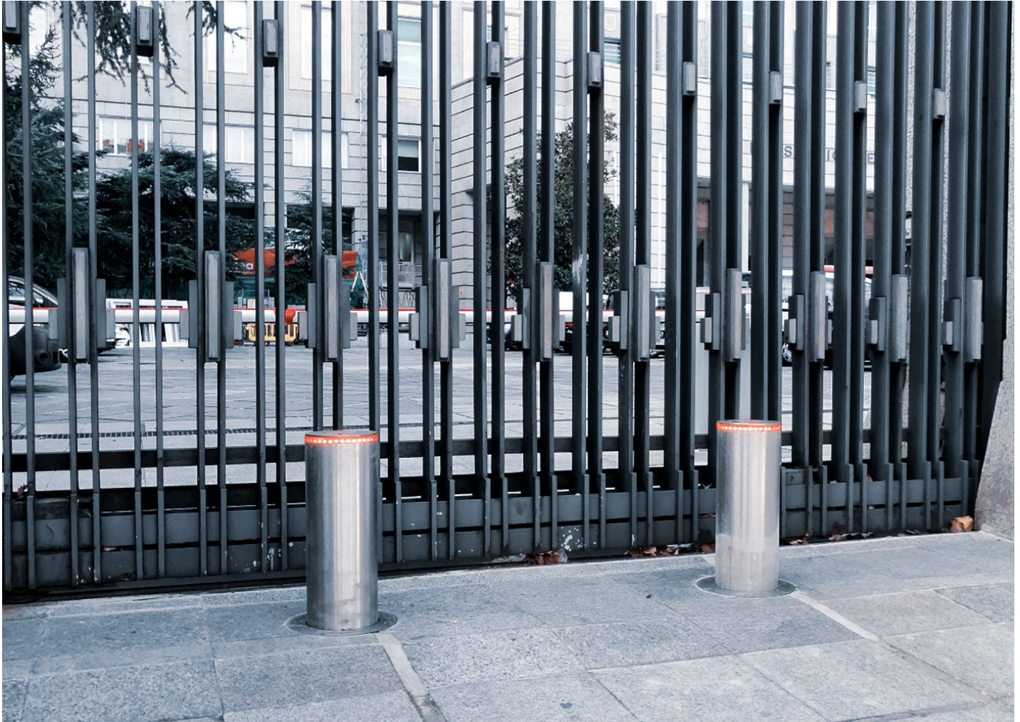
TELESCOPICA Automatischer Poller H6008