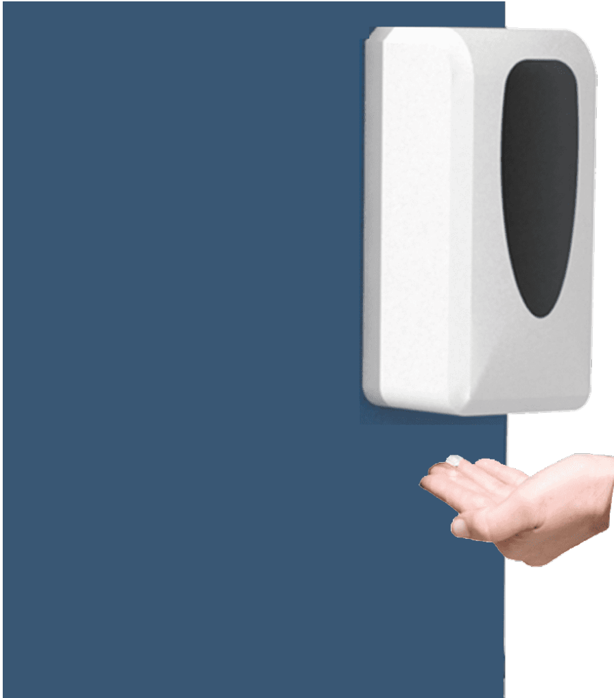
Desinfektionsmittelspender AUTOMATICO V3P