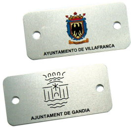
Aluminiumschild 74 x 35 mm