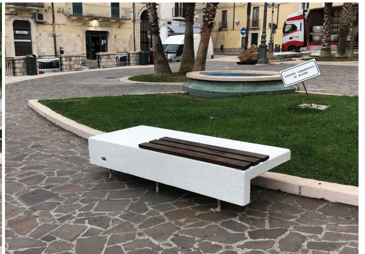
Die ständige Verbesserung unserer Produkte kann zur Änderung einiger technischer Eigenschaften führen