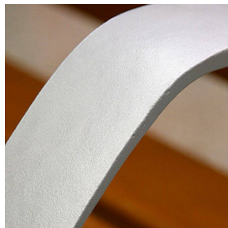
Gestell aus Aluminiumguss