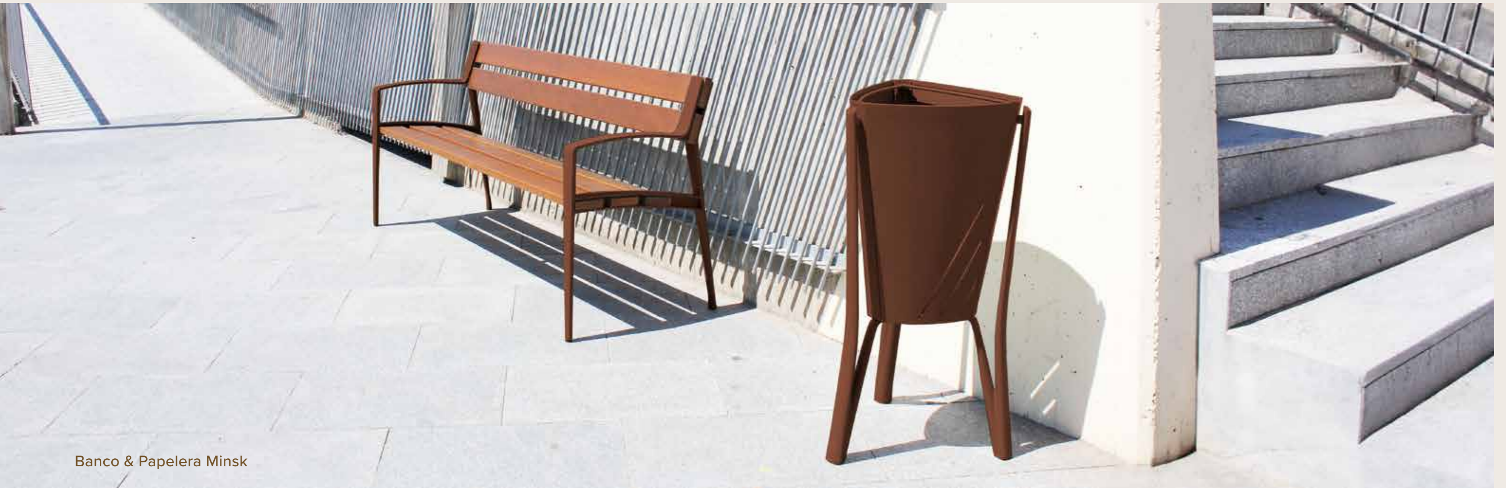
Banco & Papelera Minsk