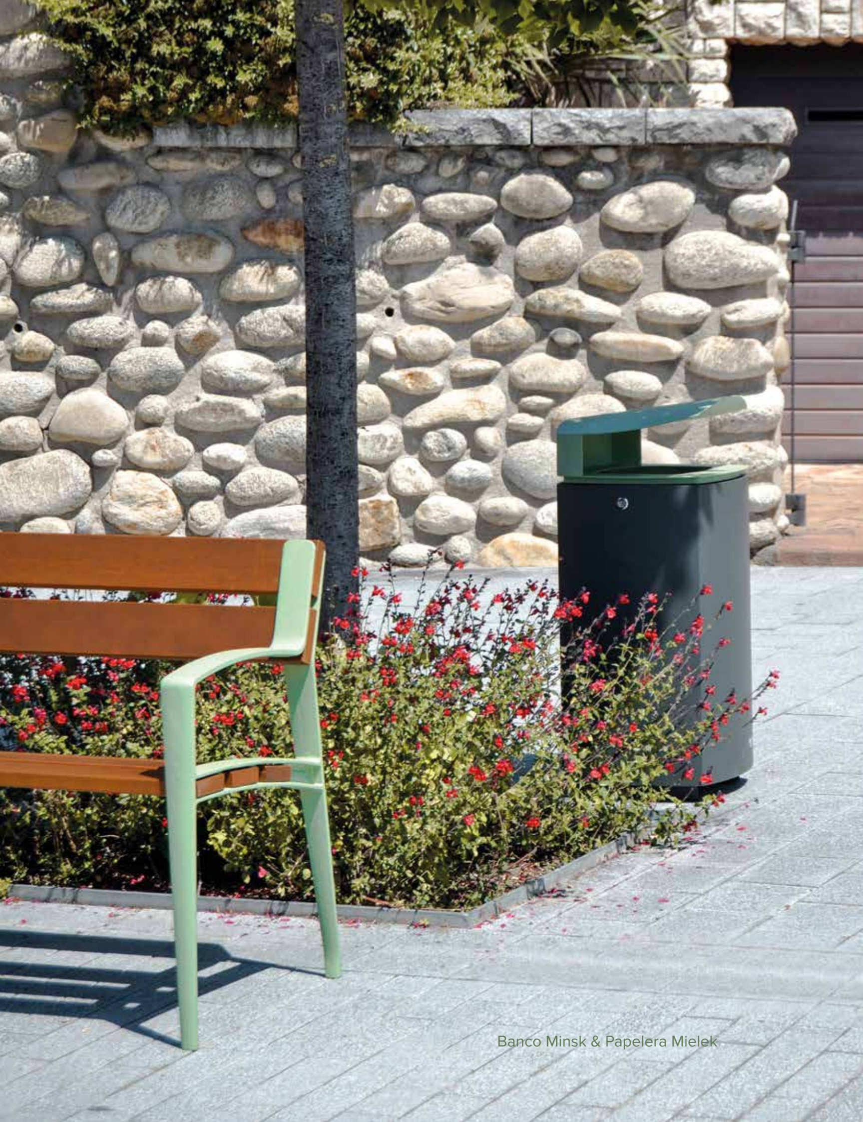
Banco Minsk & Papelera Mielek