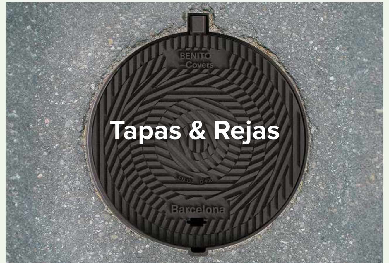
Tapas & Rejas