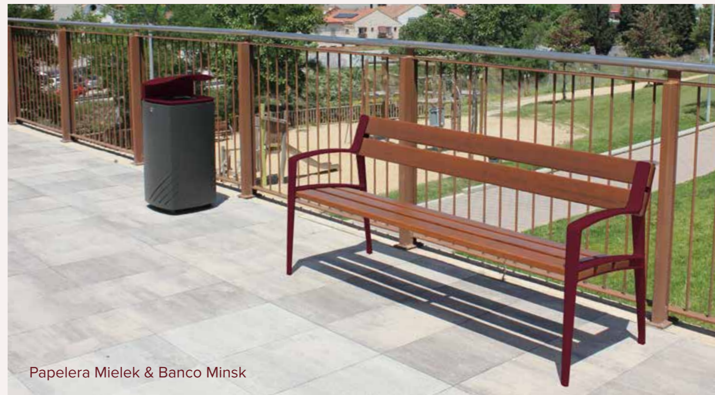
Papelera Mielek & Banco Minsk

Una combinación sofisticada y llena de fuerza que evoca un ambiente maravilloso y cálido.