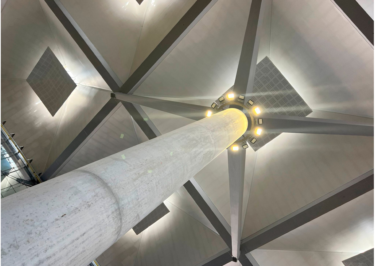
Milan XL APMXL

L'Aeroport de Màlaga, equipat amb projectors Milan, un dels nostres projectors amb més ampli rang de potències i distribucions lumíniques, per adaptar-se a qualsevol projecte.