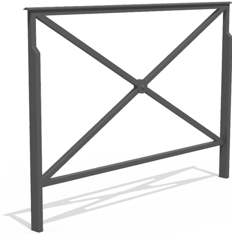
St André Amovible VVBA164M-1