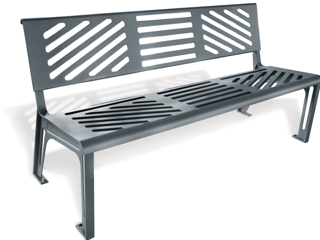
Cadira Essen UM379S