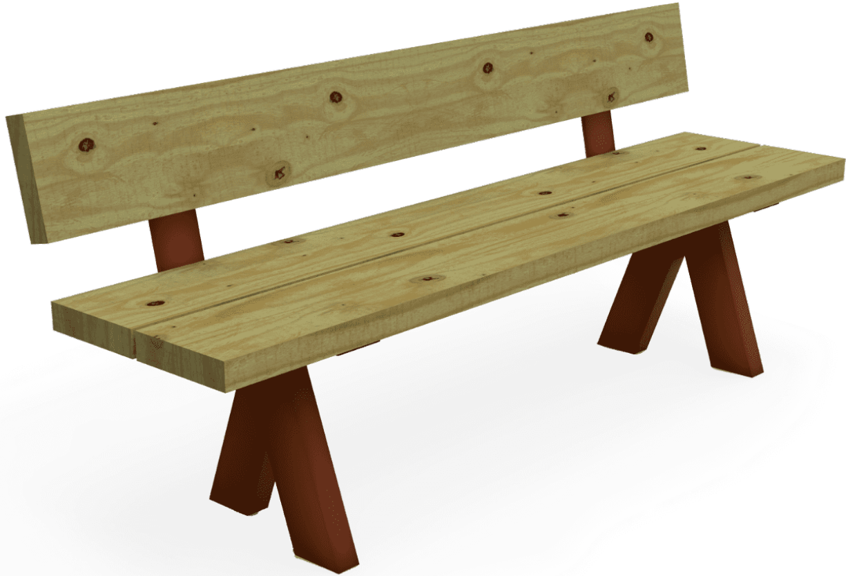
Banqueta Olea UM314B