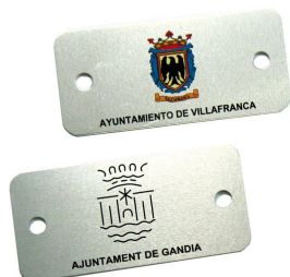
Plaqueta alumini 74 x 35 mm.