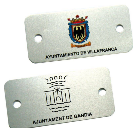
Plaqueta alumini 74 x 35 mm.