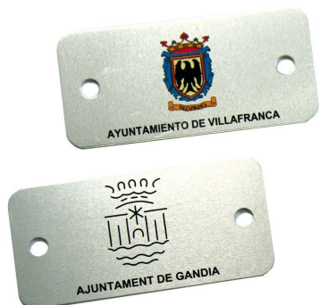
Plaqueta alumini 74 x 35 mm.