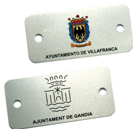
Plaqueta alumini 74 x 35 mm.