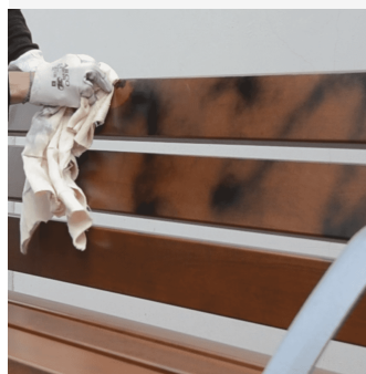
Protector del material de pintures, gafitis....