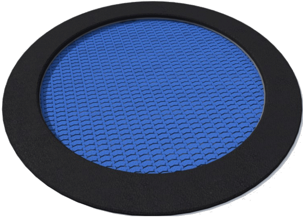
Llit elàstic circular.