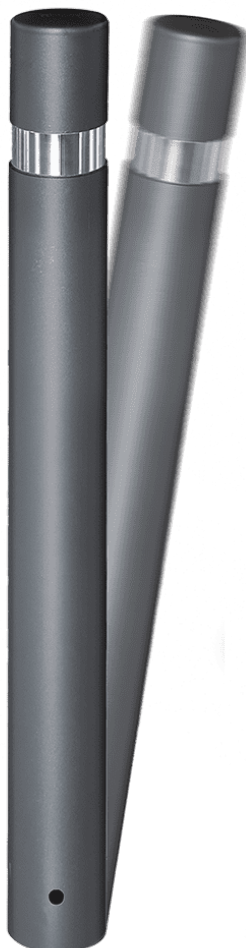
HOSPITALET DURABLE MOBIL H214FM